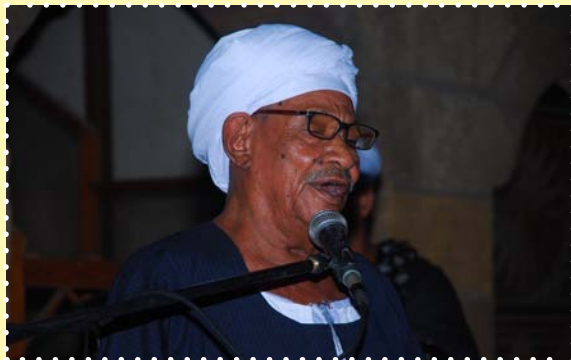
سيد الضوى-بيت السحيمي