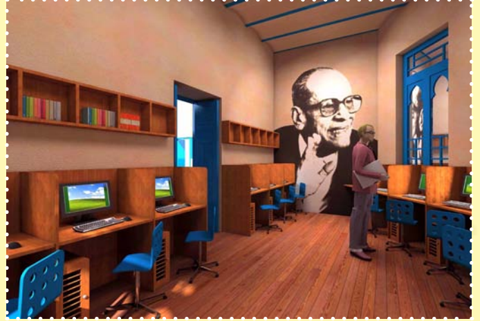
تكية أبو الذهب متحف نجيب محفوظ