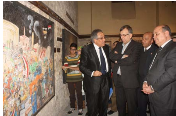
معرض كاريكاتير شاهد على مصر