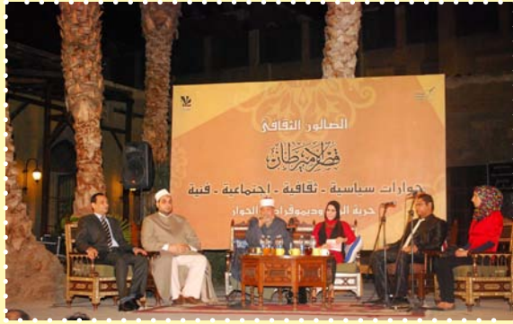
الصالون الثقافي اخلاقتنا ومنهج القرآن في رمضان -قصر الامير طاز