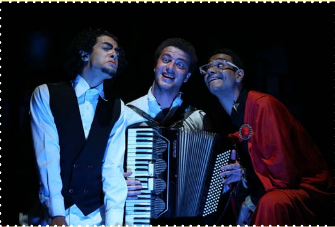
مسرحية هبط الملاك في بابل