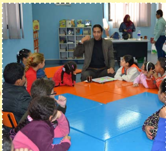
ندوة تنمية بشرية-مركز طلعت حرب الثقافي