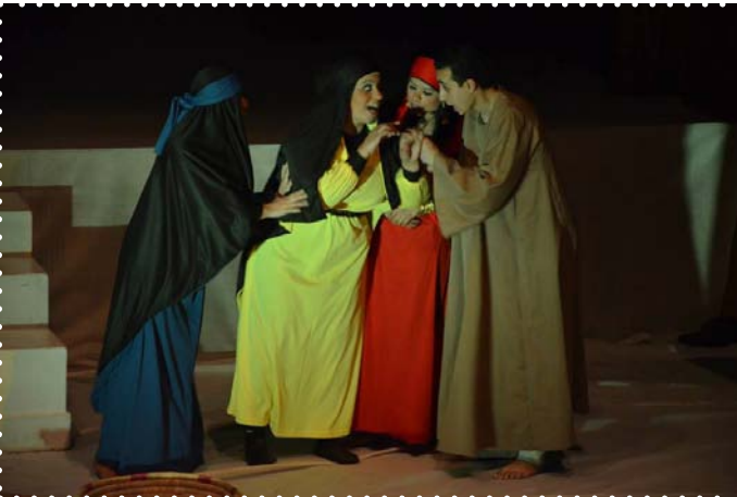
مسرحية عرق البلع