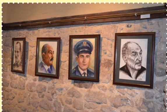
معرض شخصيات نصر أكتوبر-قصر الأمير طاز