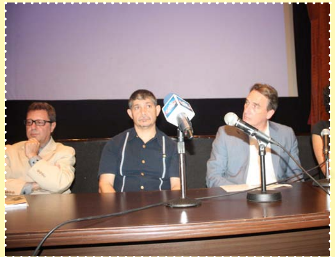
مهرجان بين سينمائيات