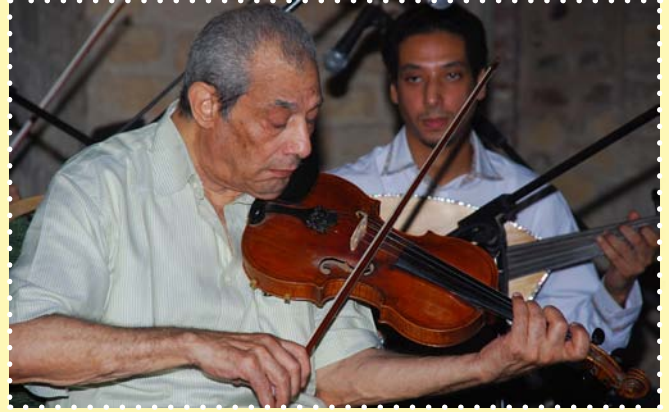
عبدہ داغر-قصر الأمير بشتاك