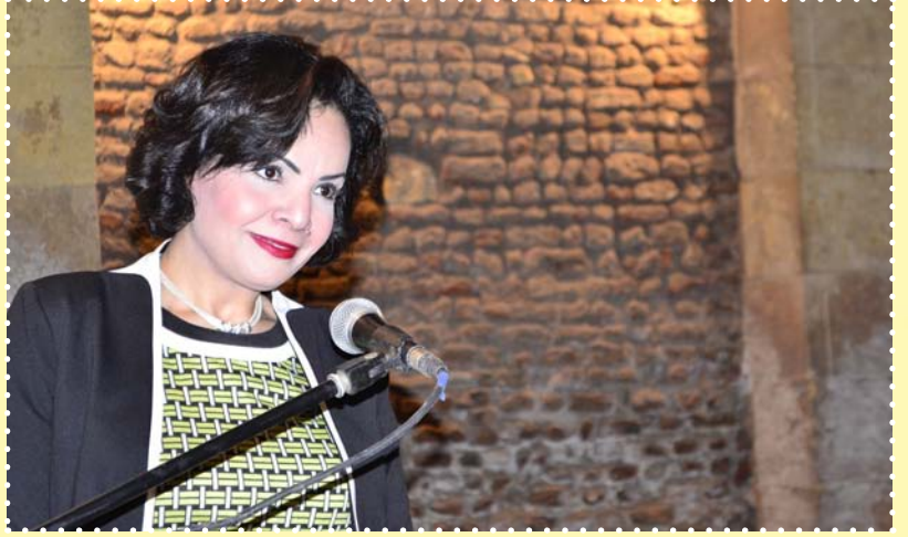
أمسية شعرية مسرحية لمجموعة من الشعراء الشباب