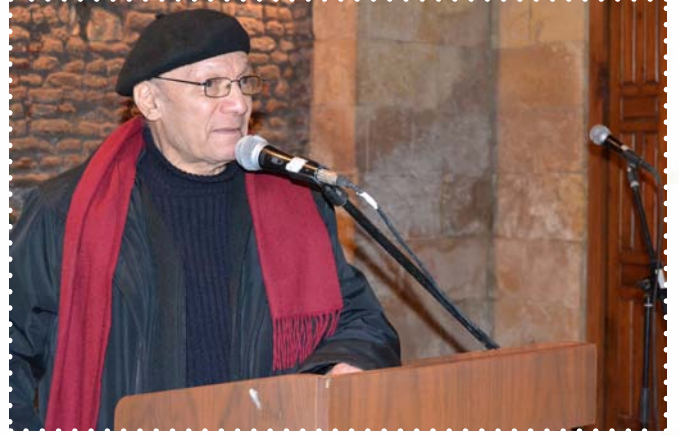
الشاعر احمد عبد المعطي حجازي - بيت الشعر