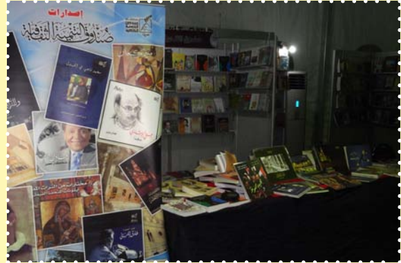
معرض الكتاب بفيصل