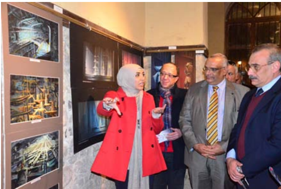
معرض كلية فنون جميلة