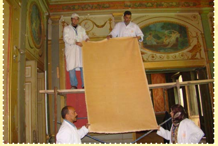
قصر عائشة فهمي بالزمالك