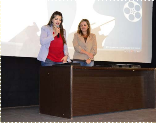
حفل ختام مهرجان قبيلة -مركز إبداع القاهرة