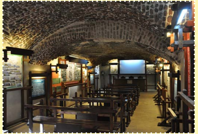
بيت علي لبيب