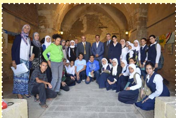
معرض اطفالنا وارض الفيروز-قصر الأمير طاز