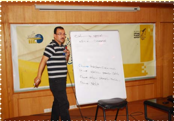
ورشة تعليم لغة إنجليزية - مركز طلعت حرب الثقافي