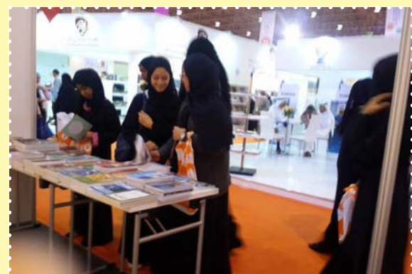
معرض الكتاب بالشارقة