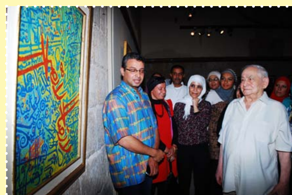
معارض زمن الفن الجميل (أمل دنقل)-قصر الأمير طاز