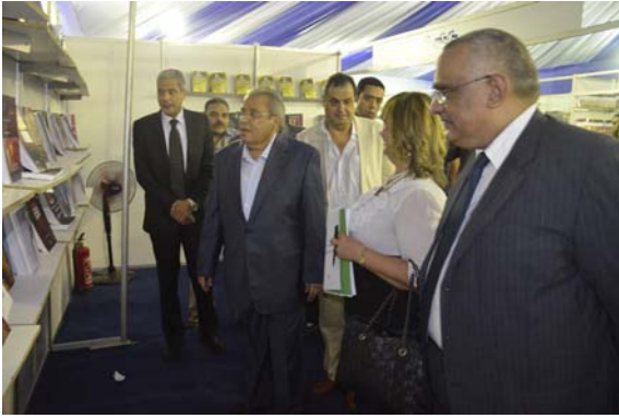
معرض إصدارات الصندوق

معرض « لجمعية فناني الغوري»، معرض «بورتريهات» للمشاهير في مجال الأدب و السياسية والفن، معرض شخصيات رمضانية، معرض «مقابر الممالك» بالتعاون مع الجهاز القومي للتنسيق الحضاري، معرض «فن الأحجار.. من الأرض» لطلبة قسم الخزف كلية الفنون التطبيقية، جامعة حلوان و ذلك لاهياء فن الموزاييك، معرض «البازار» للحرف اليدوية، معرض الخط العربي، معرض «تحيا مصر» قبة الغوري، معرض «شخصيات رمضانية» قصر الأمير طاز، معرض جماعي «ألوان مصرية» قصر الأمير طاز، «شخصيات نصر أكتوبر» قصر الأمير طاز، «زمن الفن الجميل» قصر الأمير طاز، «بورتريهات الكاريكاتير» قصر الأمير طاز، معرض «بكرة أحلي» مركز الهناجر، «أوليا جولي التركي» مركز الحرية للإبداع الاسكندرية، «الصين في عيون مصرية» مركز الحرية للإبداع الاسكندرية، «لمحات من مصر» مركز طلعت حرب الثقافي، معرض «أوائل الخريجين ٢٠١٤ » لكليات الفنون الجميلة - التطبيقية - التربية الفنية» جامعة حلوان.