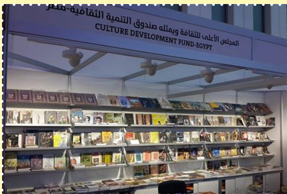
معرض الكتاب بالشارقة