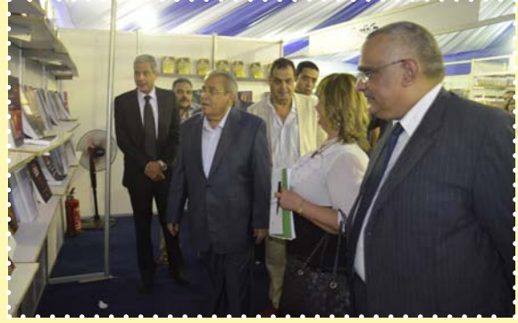
معرض اصدرات وزارة الثقافة-ساحة دار الأوبرا