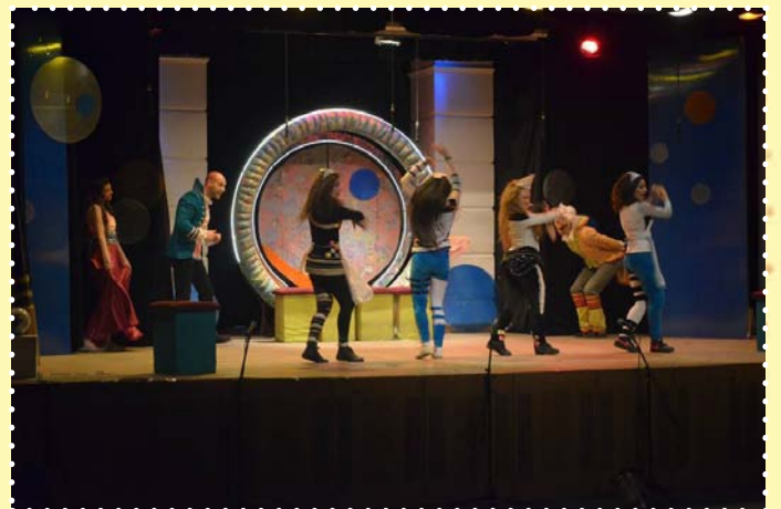
مسرحية ماك ولي