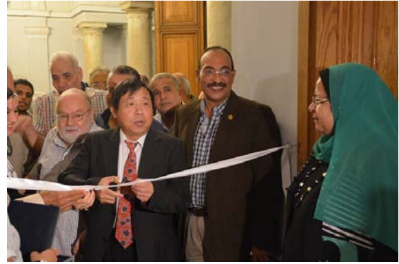
معرض الصين في عيون مصرية