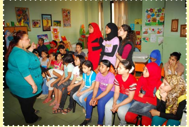
فريق كورال - مركز طلعت حرب الثقافي