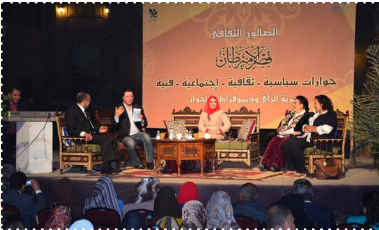
مصر تنتظر الرئيس - قصر الامير طاز