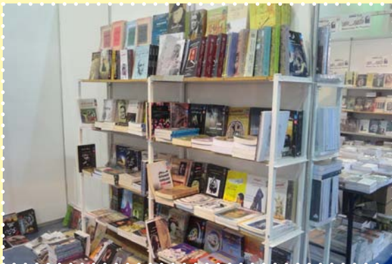
معرض الكتاب بالكويت