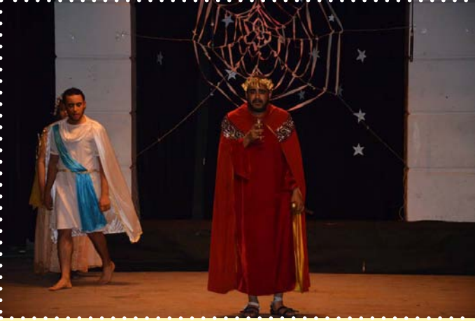
مسرحية أكليل الغار