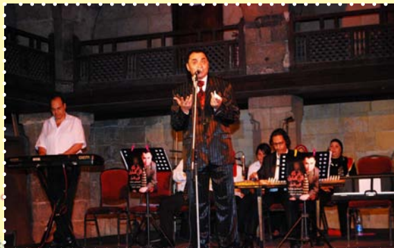
حفل فرقة الفن الصادق في إطار الاحتفال بالشاعر امل دنقل-مركز ابداع وكالة الغورى للفنون التراثية