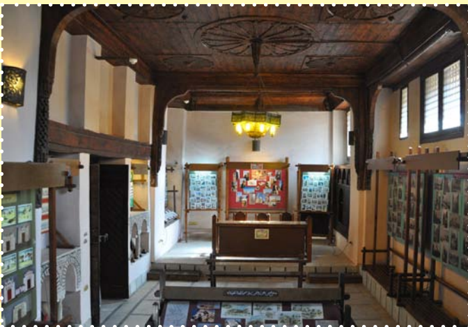
بيت علي لبيب