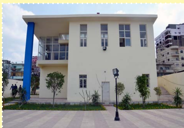
مكتبة نعمان عاشور