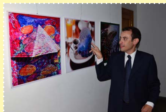
معرض لمحات من مصر-مركز طلعت حرب الثقافي