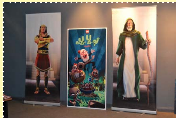
افتتاح معرض الرسوم المتحركة-مركز الهناجر للفنون