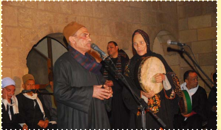
فرقة النيل للآلات الشعبية