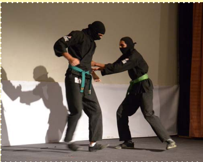
إسبوع السينما الياباني