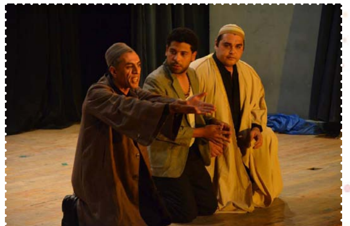
مسرحية صاحب السعادة