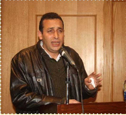
الاحتفال بذكرى صلاح جاهين-مركز طلعت حرب الثقافي