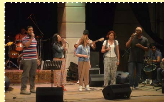
حفل انا مصرى -مركز الحرية للإبداع