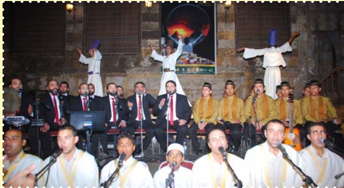
رسالة سلام-قبة الغوري