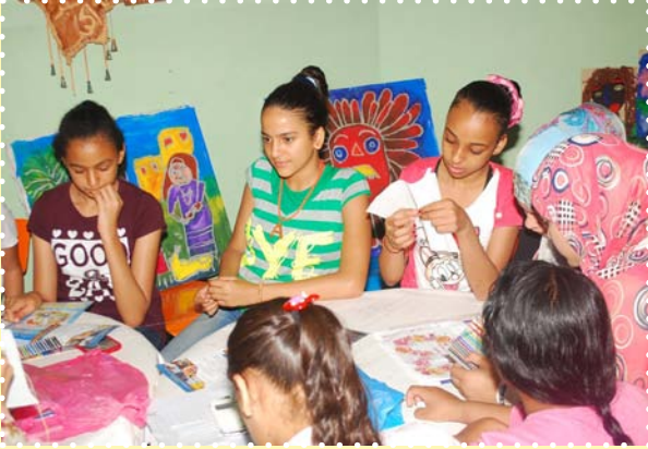
ورشة ابدعات صغيره بخامات متنوعه - مركز طلعت حرب الثقافي