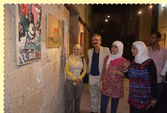
معرض شخصيات رمضان-قصر الأمير طاز