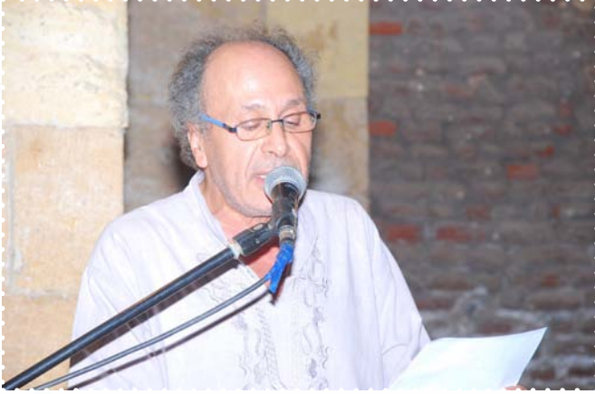
الاحتفال بذكرى الشاعر حلمي سالم

نظم صندوق التنمية الثقافية خلال الفترة من يناير ٢٠١٤ إلى ديسمبر ٢٠١٤ ما يقرب من (٤١) أمسية شعرية، حيث أقام بيت الشعر العربي عدد (٣٢) أمسية شعرية، كما استضافت مراكز الإبداع الأخرى عدداً من الأمسيات الشعرية التي أتاحت الفرصة للمبدعين من الشعراء لتقديم إبداعاتهم. وقد أقام بيت الشعر العربي أمسيات عن الشعر في الثورات العربية شارك فيها شعراء من أقطار مختلفة من الوطن العربي بالإضافة إلى تنظيم ورشة في العروض والبلاغة وأمسية شعرية غنائية كما أقام بيت الشعر العربي تكريم الشاعر إبراهيم أبو سنة - ذكرى الأربعين للشاعر أحمد فؤاد نجم - الاحتفال بمرور أربعة أعوام على افتتاح بيت الشعر - الاحتفال بذكرى الشاعر حلمي سالم كما أقام مركز طلعت حرب الثقافي حفل بذكرى صلاح جاهين للشاعر أمين حداد ومجموعة من الشعراء.