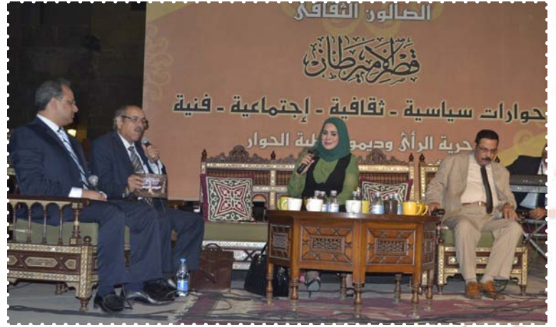
الصالون الثقافى الاحتفال بنصر أكتوبر - قصر الامير طاز