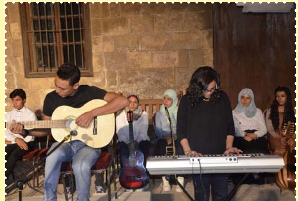
الموسيقى - قصر الامير طاز