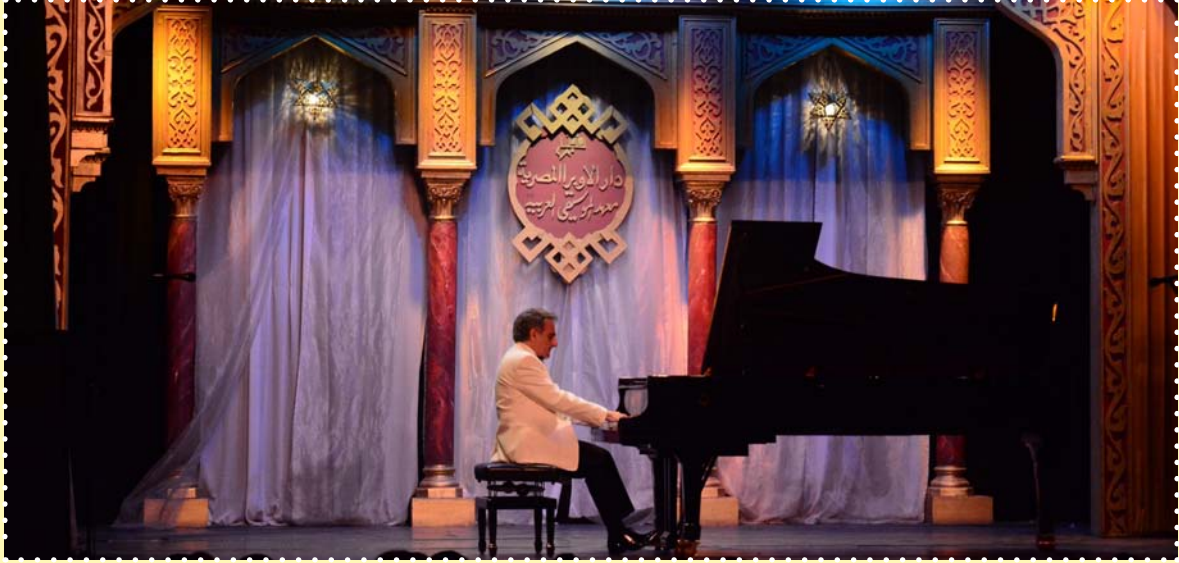
إحدى حفلات المركز الدولي للموسيقى-قصر الأمير محمد علي بالمنيل