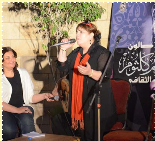
صالون أم كلثوم الثقافي بعنوان إبداعات بليغ حمدي لكوكب الشرق متحف أم كلثوم