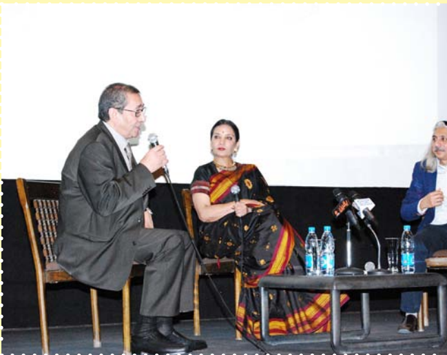
مهرجان الهند على ضفاف النيل