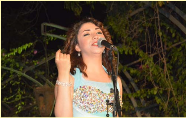
ايه عبد الله-متحف أم كلثوم