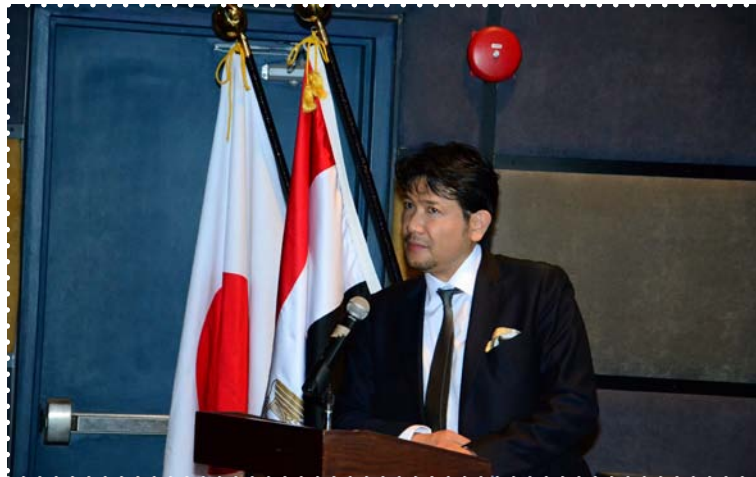
افتتاح عروض الافلام اليابانية-مركز إبداع القاهرة