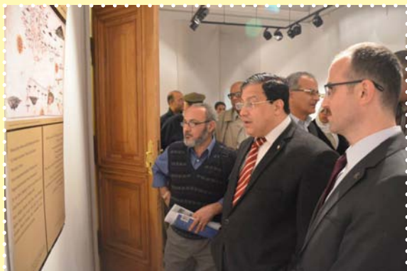
معرض أوليا جوليى التركى-مركز الحرية للإبداع