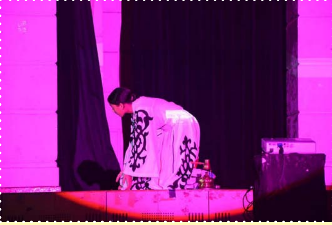
مسرحية حفل الصامتين