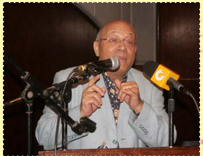
مهرجان شنت الدولي