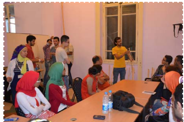
ورشة طيارة ورق - مركز الحرية للإبداع بالاسكندرية