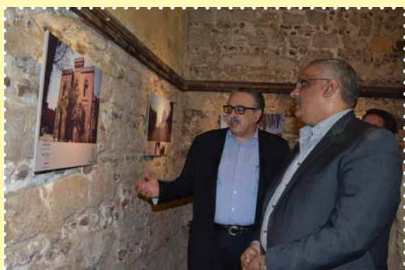
معرض مقابر المماليك -قصر الامير طاز