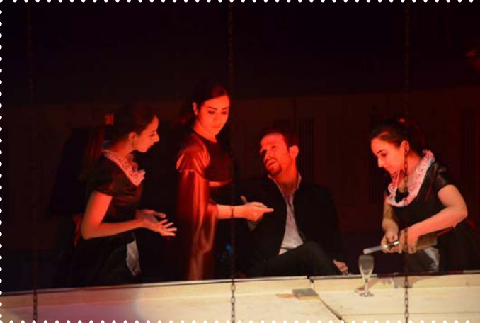
مسرحية رقصة الموت

قدم الصندوق أيضاً عدداً من العروض المسرحية الأخرى، سواء من إنتاجه، أو من إنتاج جهات أخرى، وتنوعت هذه العروض ما بين العرائس، ومسرحيات مقدمة للأطفال كما عرض مجموعه متنوعه من العروض المسرحية منها: (إكليل الغار- عن العشاق- ماك بث مباشر- ابن النهر- الصخرة - بلد البنات- صاحب السعادة -رقصة الموت- عرق البلع-حديث المدينة- عرض مسرحية رجل العلبة-بعد الليل) .