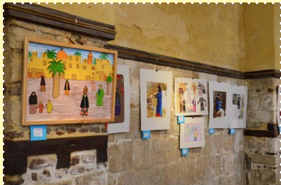
افتتاح معرض المهرجان الفني العربي « أزياء بلادى »-قصر الامير طاز