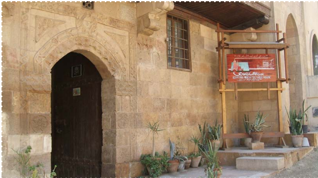
بيت علي لبيب