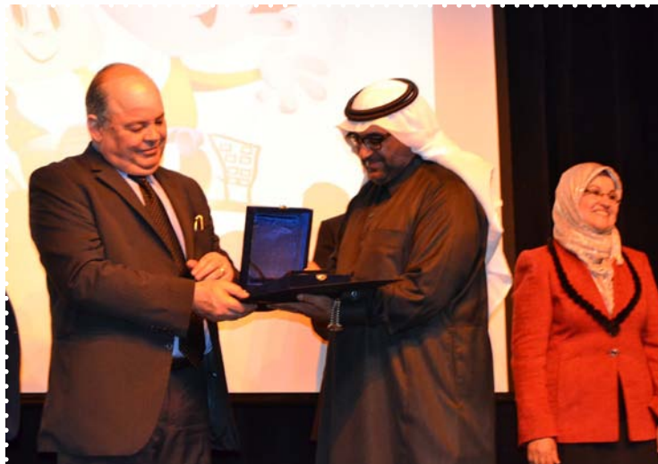
ملتقى الرسوم المتحركة «الدورة السابعة»