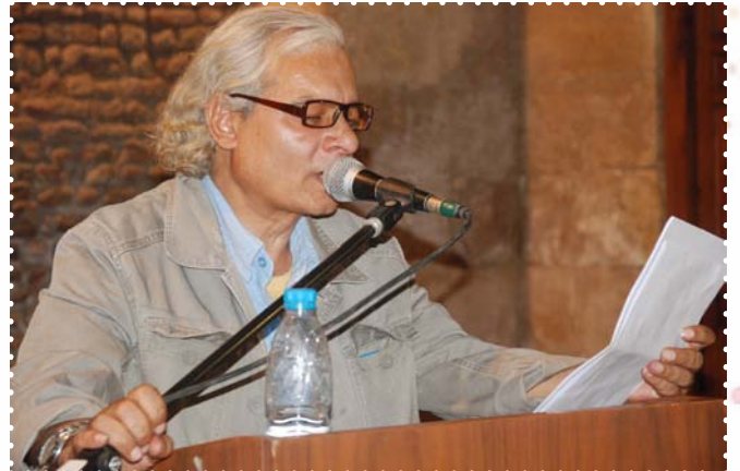
الاحتفال بمرور أربع اعوام على افتتاح بيت الشعر