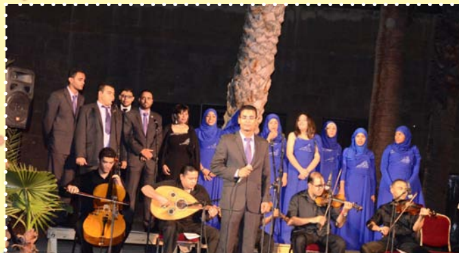
فرقة تراث سيد درويش- قصر الامير طاز