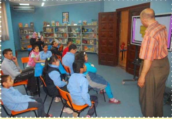
ورشة بكرة احلى - بيت العيني