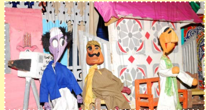
الليلة الكبيرة-مركز طلعت حرب الثقافي