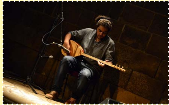
حفل الفنان عبدالله ابو ذكرى-بيت العود العربى