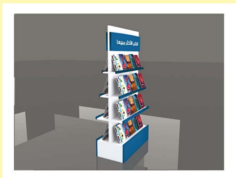
منظور ثلاثي الأبعاد لأعمال تنفيذ مشروع (اقرأ)