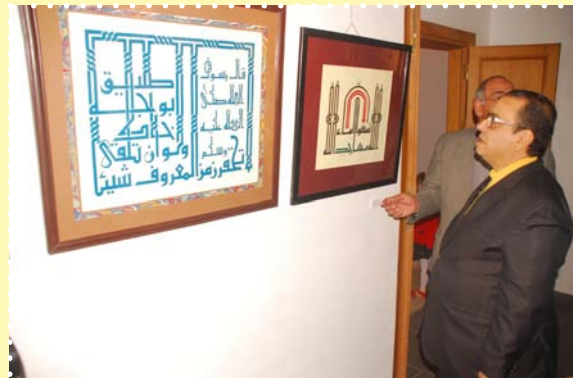
افتتاح معرض الخط العربي -مركز طلعت حرب