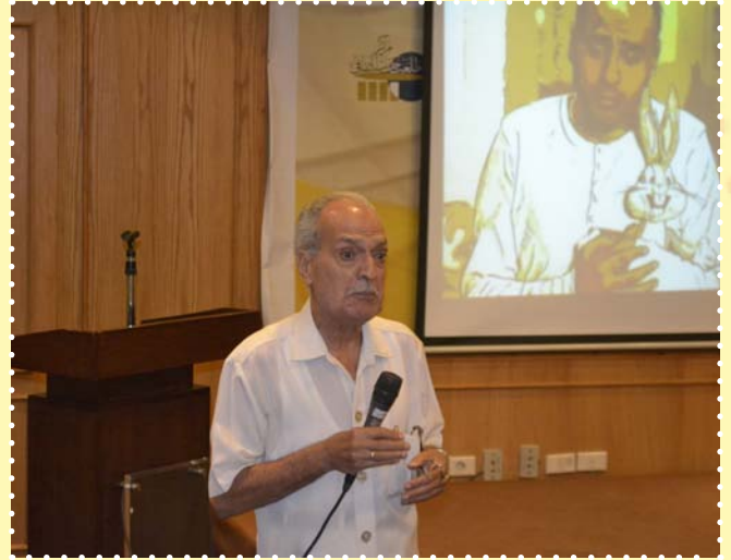
نادى السينما-مركز طلعت حرب الثقافى