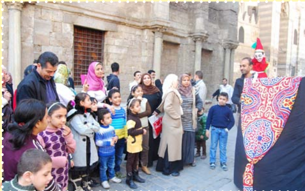
الأراجوز في شارع المعز