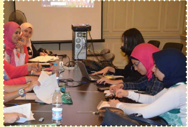
ورشة تصميم الازياء - مركز الحرية للإبداع بالاسكندرية