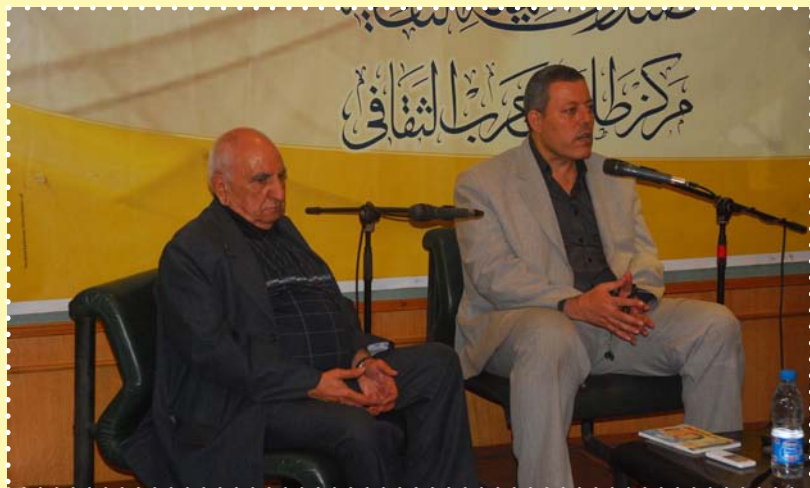
الصالون الثقافي-مركز طلعت حرب الثقافي