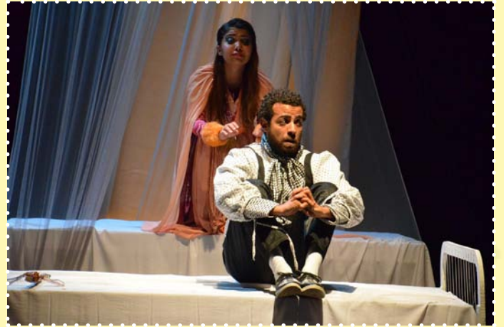
مسرحية ماك نون