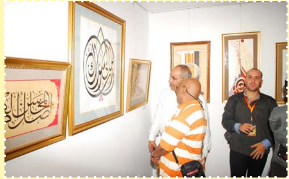
معرض الخط العربي-مركز طلعت حرب الثقافي