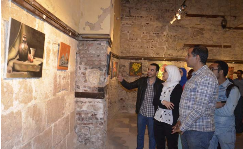
معرض ألوان مصرية - قصر الأمير طاز

معرض على هامش الملتقى العربي للرسوم المتحركة «الدورة السابعة» ، معرض جماعي للمشغولات اليدوية بعنوان «بلدي» ، و سلسلة من معارض « الزمن الفن الجميل» و ذلك بمناسبة ذكرى الفنان عبد الحليم حافظ، عبد الوهاب ، الموجى ، أم كلثوم ، معرض «خط عربي لمجموعة من الخطاطات» في إطار الاحتفال بيوم المرأة العالمي ، المهرجان الفني العربي الثاني «أزياء بلادي» بمشاركة الدول العربية لذوى الاحتياجات الخاصة، معرض تصوير ضوئي «القاهرة ملتقى الأديان» للفنان/ شريف سنبل، معرض الشاعر «أمل دنقل» في ذكرى وفاته و معرض في مجال النحت الزجاجي «دقة نحاة» تحت إشراف الفنانة / حورية السيد ، نتاج ورشة لمجموعة فنانات من صعيد مصر،