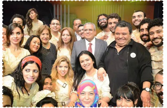
وزير الثقافة مع فريق مسرحية بعد الليل