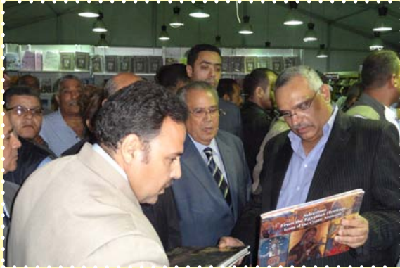
معرض الكتاب بفيصل