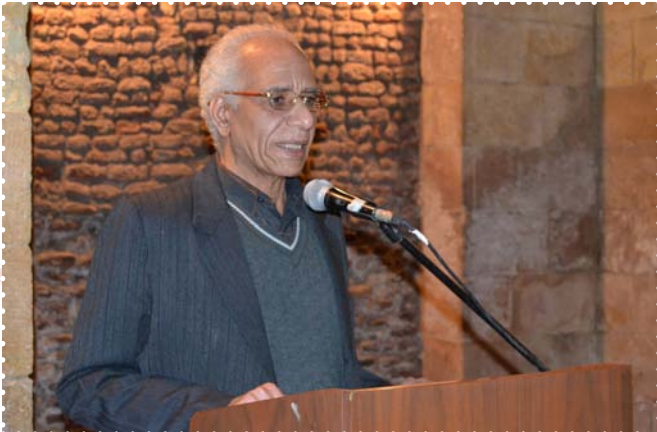
ذكرى الاربعين للشاعر أحمد فؤاد نجم