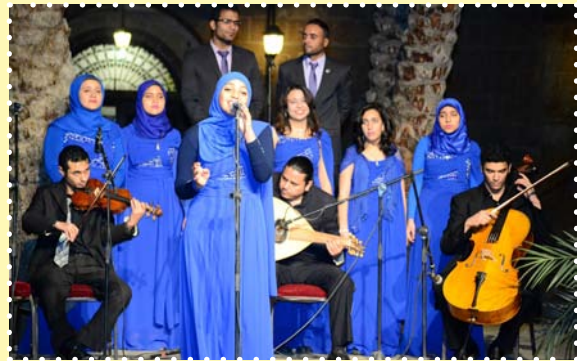
جمعية سيد درويش-قصر الامير طاز