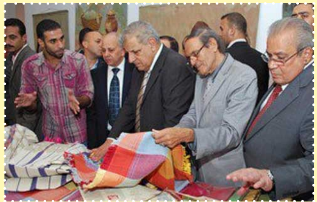
افتتاح مهرجان الحرف التقليدية السابع