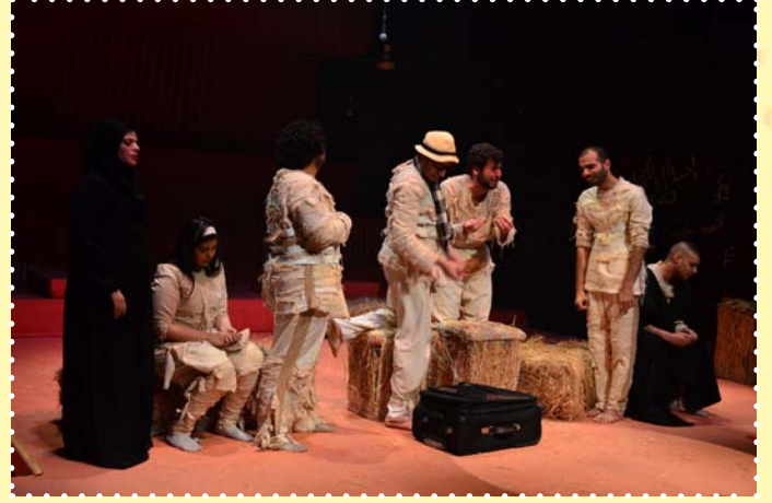
مسرحية بعد الليل