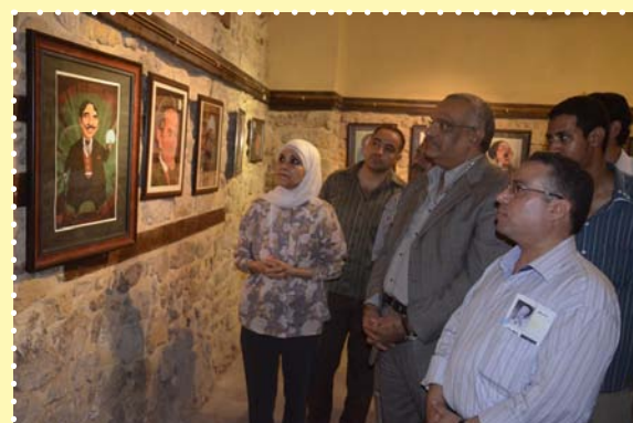
معرض بورتريهات - قصر الامير طاز