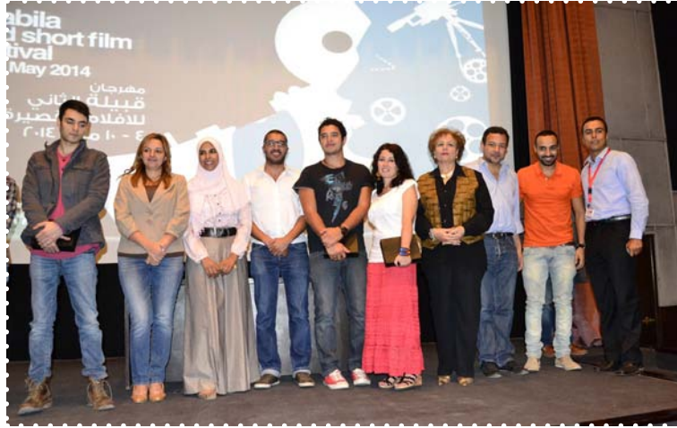
مهرجان قبيلة - مركز إبداع القاهرة

إيماناً من الصندوق بدور السينما في الرقي بالفكر، وأثرها في المجتمع، فقد تم تنظيم (٢١٢) عرضاً سينمائياً خلال الفترة من يناير ٢٠١٤ إلى ديسمبر ٢٠١٤ وذلك من خلال نادي السينما الذي ينظم أنشطته في مراكز الإبداع المختلفة، والذي يهتم بالنقد والتحليل للأعمال السينمائية الجادة، حيث عرض مركز الإسكندرية للإبداع (٧٢) فيلماً عربياً وأجنبياً. كما نظمت سينما مركز الإبداع الفني بالقاهرة ما يقرب من (٣) أسابيع سينمائية لدول مختلفة من بينها «أسبوع أفلام أحمد فؤاد درويش، أسبوع الأفلام اليابانية، ندوة عن الأغنية في الأفلام الهندية، مهرجان الهند على ضفاف النيل، مهرجان جمعية الفيلم السنوي، مهرجان شنيت للأفلام القصيرة ومهرجان مصرى أصلي المتنقل للأفلام» كما نظم مركز طلعت حرب الثقافي «الملتقى السابع لأفلام الرسوم المتحركة» ٩: ١٤ فبراير ٢٠١٤ والذي شارك فيه أكثر من (٥٥) فيلماً، ويتم تنظيمه بالتعاون مع الجمعية المصرية للرسوم المتحركة.