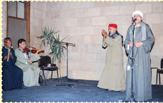
حفل المنشد التونسي-بيت السحيمي