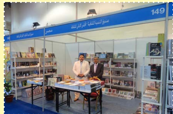
معرض الكتاب بالكويت